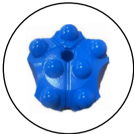
BROCA DE BOTONES ESFÉRICOS