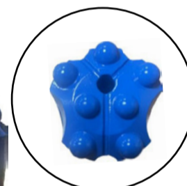
BROCA DE BOTONES ESFÉRICOS