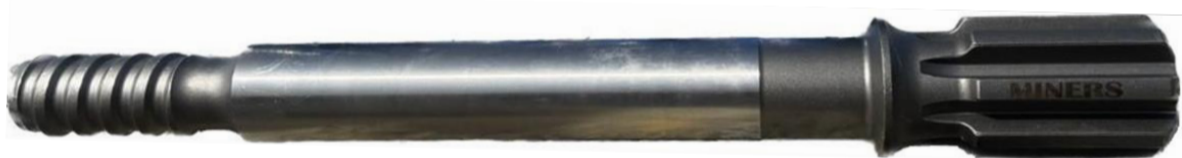
Shank HXL5 T38 x 500 mm