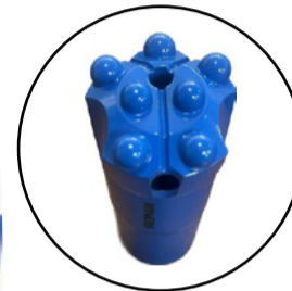
BROCA DE BOTONES ESFÉRICOS