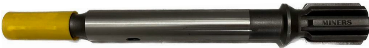
Shank HC95 T38 x 504 mm (Orificio superior)