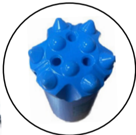
BROCA DE BOTONES BALÍSTICOS