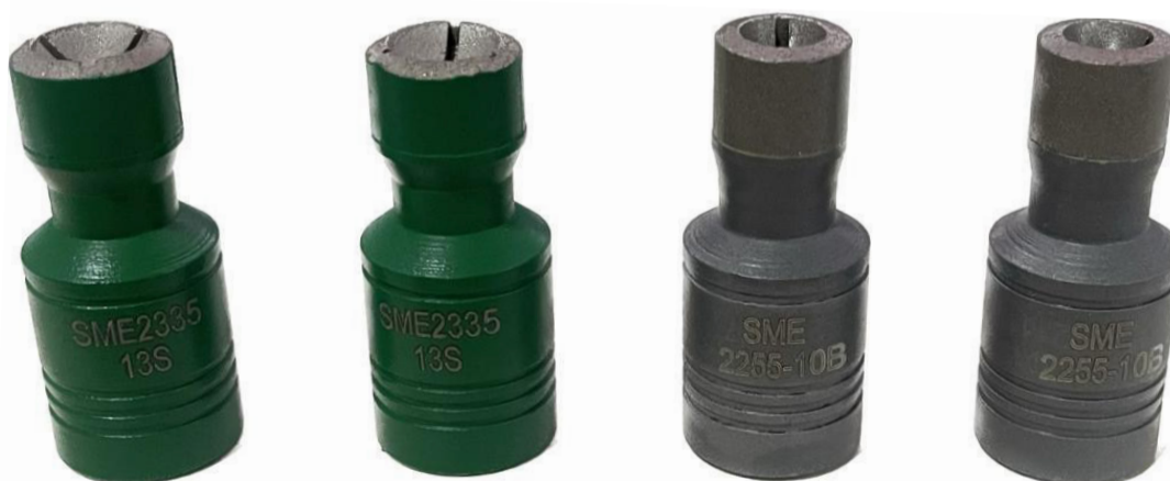
COPA DE AFILADO PARA INSERTOS ESFÉRICOS, SEMI BALÍSTICOS Y BALÍSTICOS