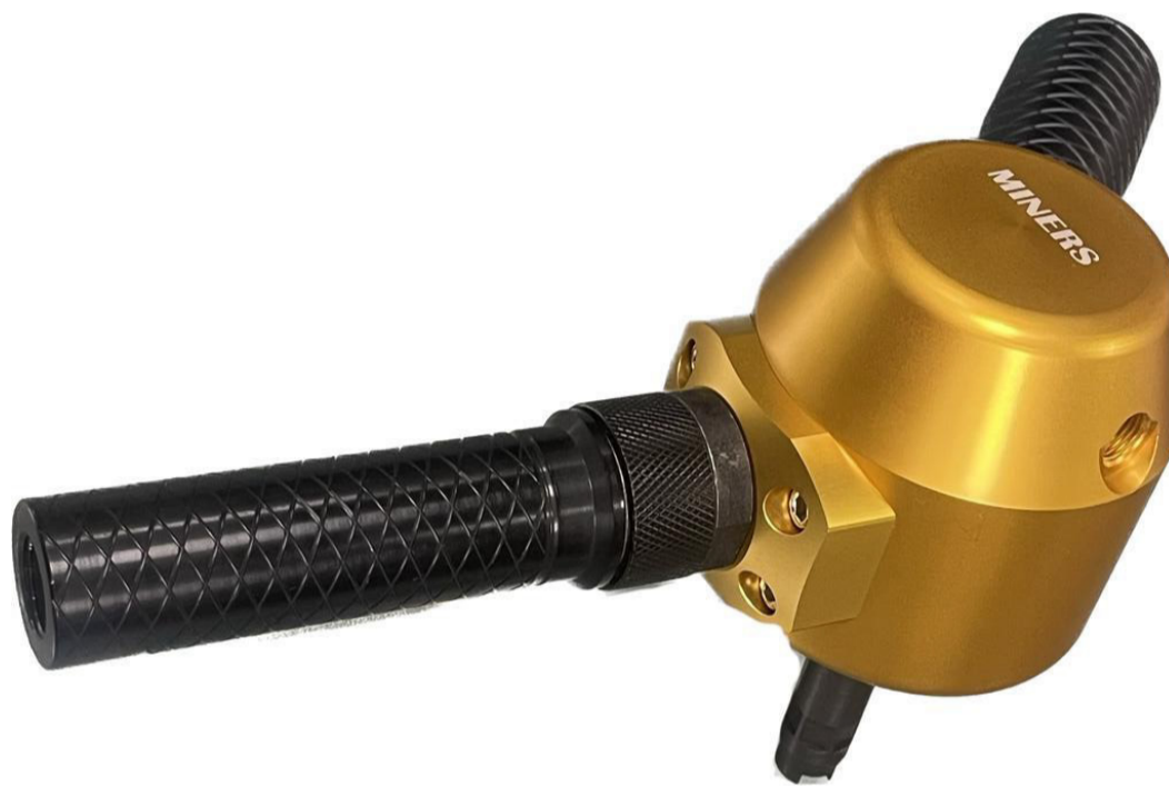
EQUIPO DE AFILADO MANUAL con adaptador multicopas – MINERS