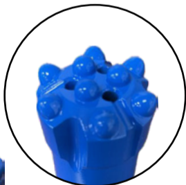
BROCA DE BOTONES SEMI BALÍSTICOS